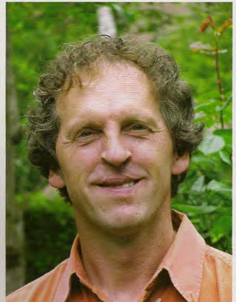
Auteur: Henk Breunissen is adviseur Sport en eigenaar van onafhankelijk sportadvies- en ontwikkelingsbureau van sportproducten Happy Feet sports systems. Permasport is tot stand gekomen in samenwerking met Intercodam en Drainproducts.

De volgende stap is het bouwen van sportvelden, waarop officiële wedstrijden gespeeld worden. Dit kan zonder problemen, omdat het materiaal hiervoor is gecertificeerd door NOC *NSF.