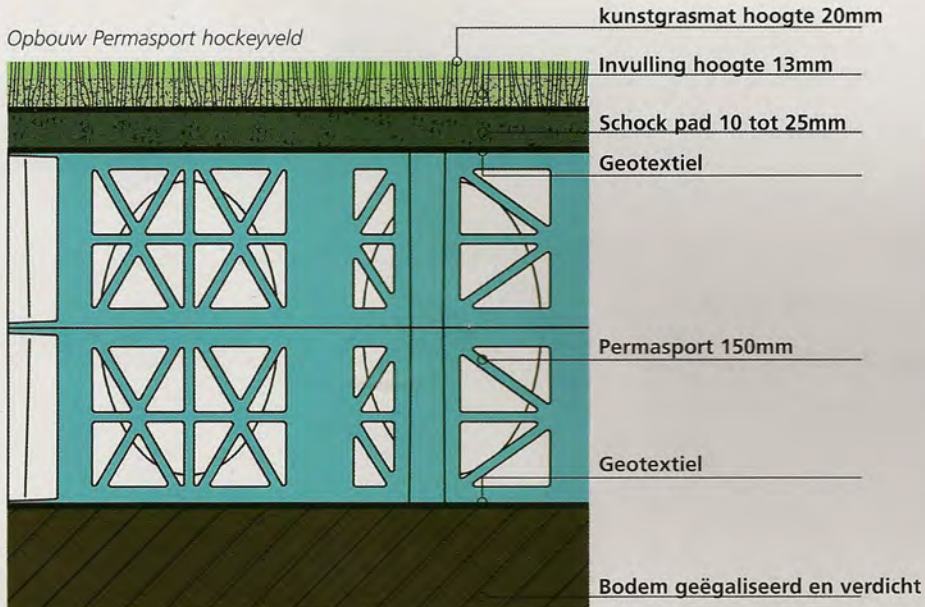
Opbouw Permasport hockeyveld

In de paardensport zie je vooral waterbergingssystemen in Engeland onder paardenbakken. Niet alleen vanwege de technische voordelen, maar vooral vanwege de positieve sporttechnische eigenschappen. Zo is deze opbouw nadrukkelijk in beeld voor de Olympische paardenbak in London in 2012.